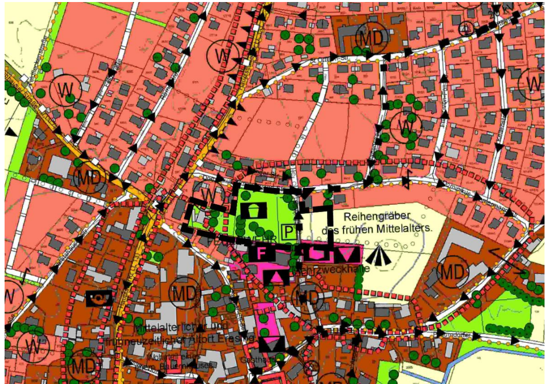
Abb. 3 Ausschnitt aus dem wirksamen FNP mit Änderungsbereich 1, ohne Maßstab