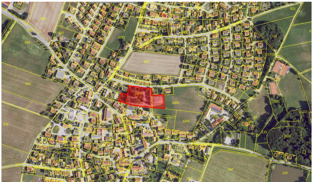
Abb. 1 Änderungsbereich 1 Pflaumdorf, ohne Maßstab, Quelle: BayernAtlas, © Bayerische Vermessungsverwaltung, Stand 02.2024

Der Änderungsbereich 1 „Feuerwehr“ umfasst die Grundstücke Fl. Nrn. 27/4, 27/2 (Teilfläche), 1000 (Teilfläche), 1003, 1002 (Teilfläche), 1002/1 (Teilfläche) und 1005 (Teilfläche) alle Gemarkung Eresing.