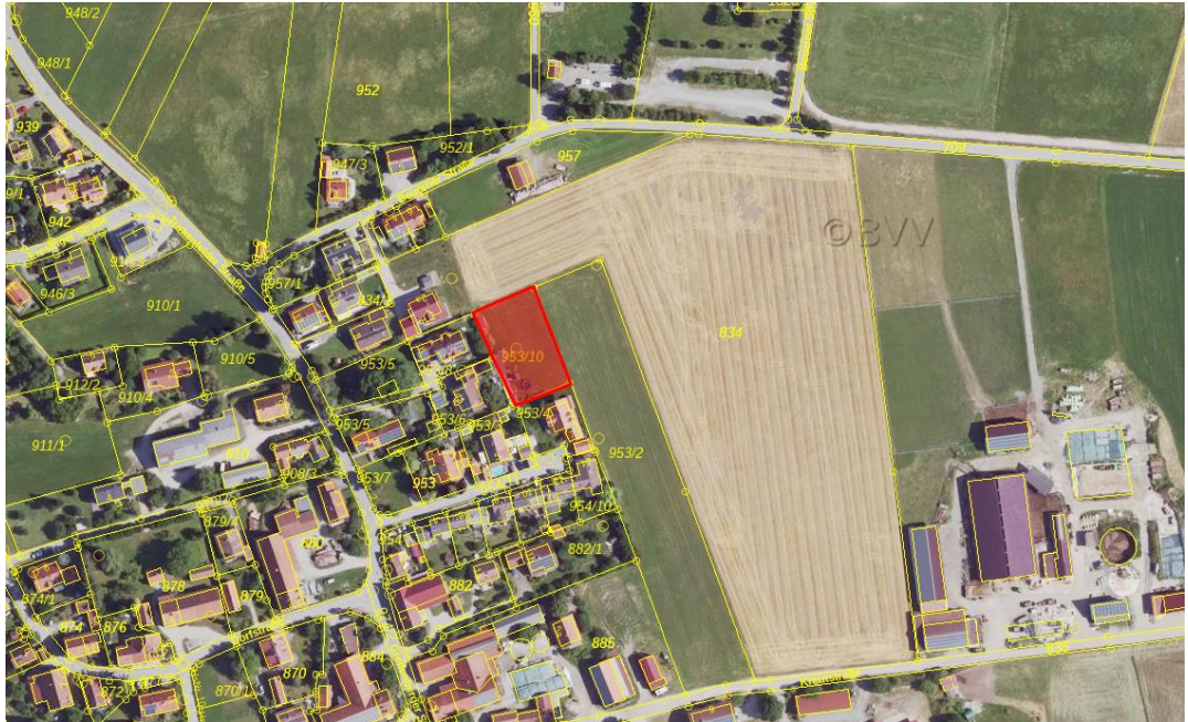
Abb. 2 Änderungsbereich 2 Pflaumdorf, ohne Maßstab, Quelle: BayernAtlas, © Bayerische Vermessungsverwaltung, Stand 02.2024

Der Änderungsbereich 2 „Pflaumdorf“ umfasst das Grundstück Fl. Nr. 953/10, GmGk Beuern.